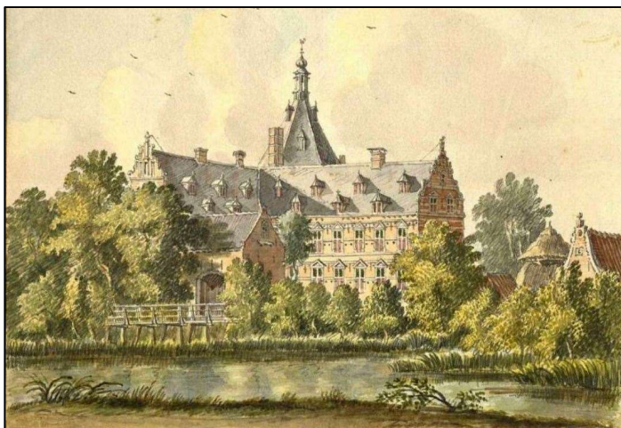
Kasteel Wolfwaard van de baronnen Pieck te Beesd