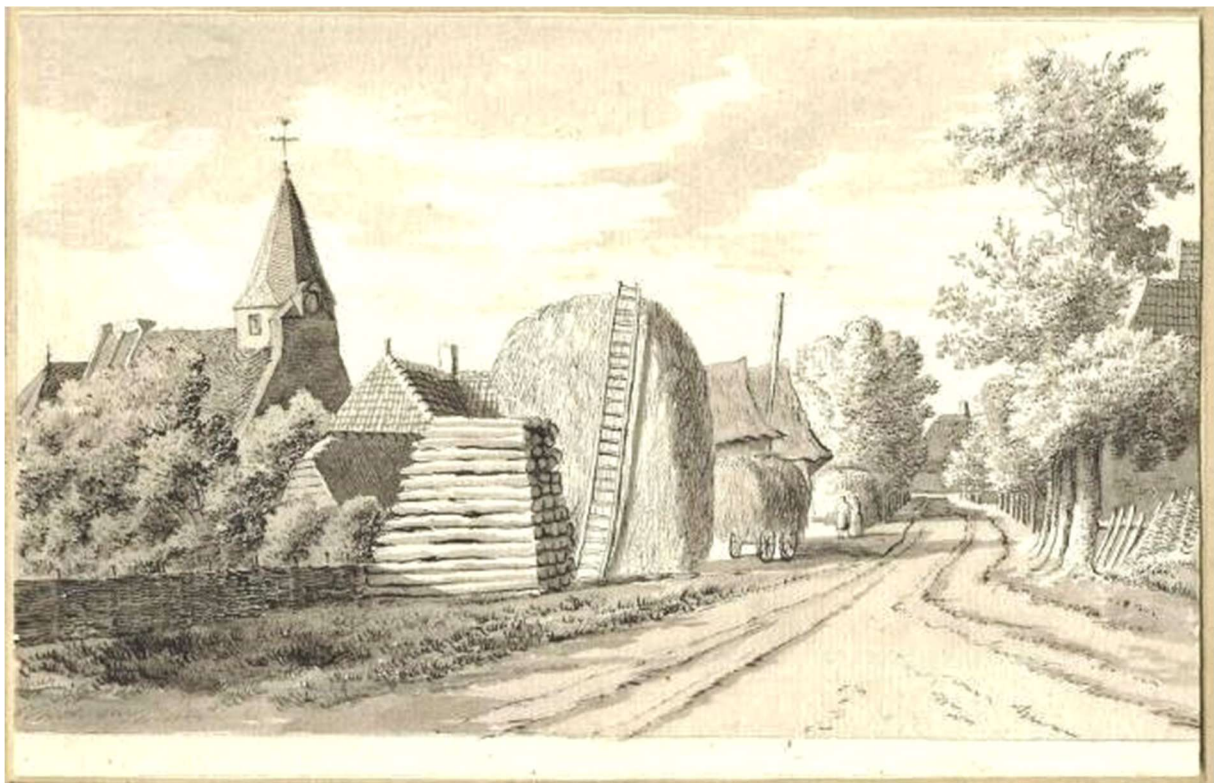
Rhenoy. Prent van Hendrik Tavenier 1785.

Rhenoy had ook zwaar te lijden door de overstroming van de Linge.