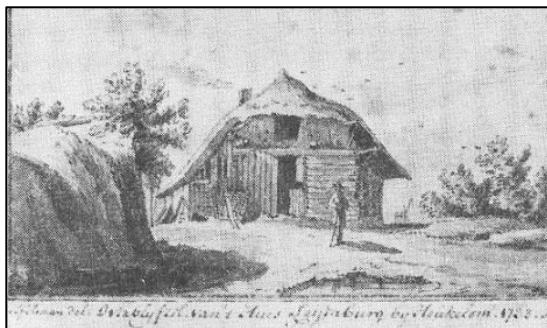
Boerderij bij Huys Leyenburg te Vuren 1733

Jan Vredenburg, Kastelen in Gelderland, Uitgeverij Matrijs, Utrecht 2013, p. 274.