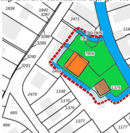
Reconstructie ridderhofstad Bottestein met de woontoren (rechts) en de boerderij (links)

Het bezitten van een riddermatig huis werd gaandeweg een statussymbool ter onderscheiding van de 'wannabe's' met adellijke pretenties. In het verleden noemde men zich niet 'heer' van een fiscale vrijstelling. Dat zou ondenkbaar zijn geweest en het gebeurde ook niet.