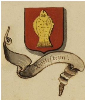
Wapen van Bottestein

Na de IJsselsteinse oorlog (1510-1511) keek het bestuur van de Staten van Utrecht tegen een berg schulden aan en een lege staatskas. De invoering in 1512 van een belasting op huizen leek een probaat middel om de financiële nood het hoofd te bieden. De adel, die een vaste vertegenwoordiging had in het bestuur, wist voor zichzelf een fiscale vrijstelling uit te onderhandelen: door het hebben van een riddermatig huis viel men buiten de heffing. De woontoren Bottestein bij Vleuten was zo 'n huis. Als er tweehonderd jaar later nagenoeg niets meer van over is, weet het zich echter te ontpoppen als prestigieuze object.