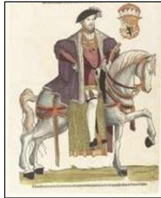
Willem van Gulik, hertog van Gelre en van Gulik (1364-1402)