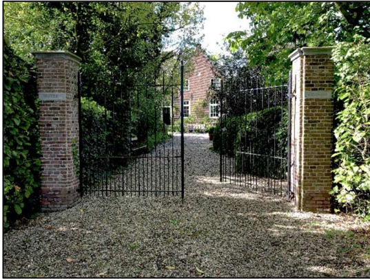
Ingang via Lingedijk