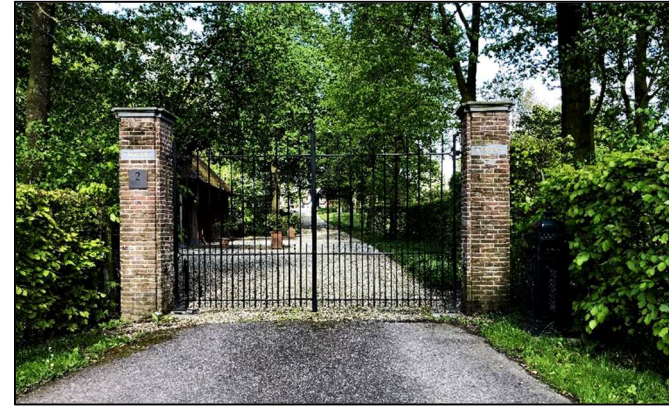
Ingang via Nieuwe Steeg

De eigenaar van het Huis Acquoy, waar de burcht gestaan heeft, gaf het Huis Acquoy aan een leenman. Deze leenman inde de inkomsten uit de Heerlijkheid van Acquoy. De lenen waren erfelijk en meestal erfde de oudste zoon deze. Bij elke vererving moest deze leen door de leenheer goedgekeurd worden. De heerlijke rechten die de leenman had waren o.a. het tiendrecht, vis en jachtrecht, verhuur van de korenmolen, veer en tol rechten en hij had het recht van wind. De meeste rechten bleven aan de heerlijkheid verbonden en gingen steeds over op de nieuwe heer. Verder had de leenheer (baron) collatie recht, het recht om een dominee te benoemen. De bewoners werden Heere en Vrouwe van Acquoy genoemd.