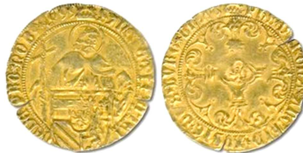
Philippus gouden gulden