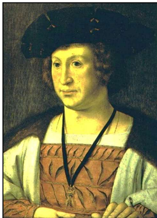
Floris van Egmond graaf van Buren, heer van Acquoy

rout om lopinde mit illi sijnen vrijheden als tienden van biistin (beesten) cijns (belasting) en der ghetijcken als dat van outs gheeweest is noch die boomgaert duijffhuijs dat riet plickskin en din steinhovi also groit en also cleijn als dat daer gheleghe is alle dit voerschreuen goet the ghebriijfcken met alle 't gheen hij daer op vijnt sonder alleen 't vourse goet niet te verminderen noch the vererghen alle dinck sonder arch off list ewilick (eweleck, eeuwig) ende erflijck (in eigendom) voir seshien gauwen hollansche phs (Philips de Schone) gulden jairs off vijf en twijntigh hollandse stuijvers voir elck phs gulden off paijement (afbetaling) huere weerden daer die eerste doch van bethalinghe off wesen sal sinte peters ad cathedram (29 juni) nu naest comede en so voirt van jaer tot jaer ueruooghende daer bouen dese goeden naest geleghen sluijs (waar Acquoy begint) campen ende waert ghelegghen eghenedigh heere veirthien hont lands noch vijff halve merghe lands noch vierhalve merghe lants beneden westwaerts naest ghelegghen die ghemeijne steghe (Nieuwe Steeg) en suijswaerts streckende den linghen dijck noch so sijnt voirwaerden dat wij altijd die plaets houwen (?) sullen daer nu ten tijt onse rosmolen op staet onbeswaert van ijimants want wij floris van egmont willen dat allen (?) vant en ghestedich wesen sall so hebben wij onsen seghel hier onder aen desen brief ghehanghen op the tweede dagh in februario anno vijftien hondert twijntich