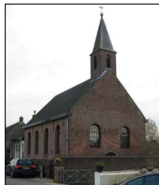
RK-kerk met voor de toren het schepenhuis