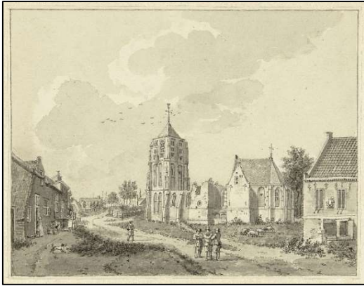
Hervormde kerk Acquoy 1784