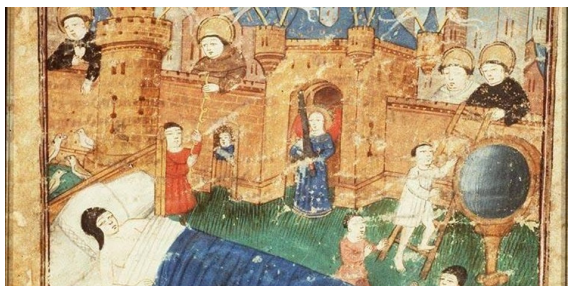
Miniatuur uit 'Die pelgrimage van der menscheliker creaturen' (KB)