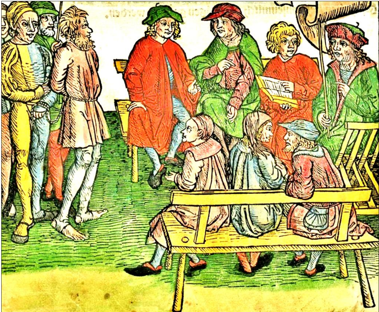
Een verdachte voor de schepenbank. (Bambergische Halsgerichtsordnung 1507)