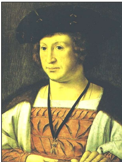
Floris van Egmond (1649-1539)

Na zijn overlijden in 1539 gaan zijn bezittingen en titels over op zijn zoon Maximiliaan van Egmond. En als Maximiliaan overlijdt in 1548 gaan al zijn bezittingen en titels over op zijn dochter Anna van Egmond (Anna van Buren). Anna trouwde in 1551 met Willem I van Oranje. Zodoende werden de Oranjes baron van Acquoy. Welke titel onze koning Willem Alexander nog heden mag voeren.