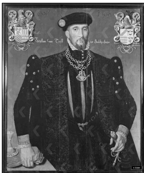
Willem van Tuyll Bulckensteijn 1560 Slot Zuylen inv. cat. nr. S 32