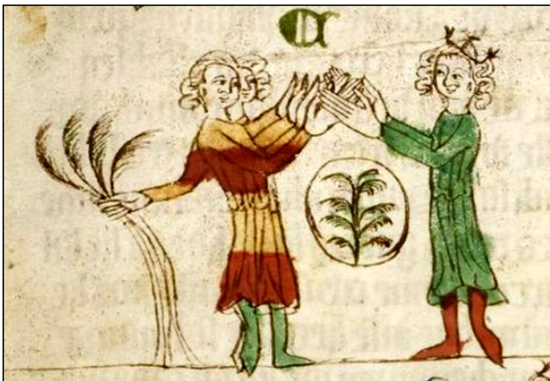
Uitsnede van folio 2 v. van de Sachsenspiegel die aanwezig is in de bibliotheek van de universiteit van Heidelberg.

In de Sachsenspiegel, een rechtsboek uit de 13 e eeuw, waarin de ridder Eike von Reggow het gewoonterecht van de Saksen beschreef wordt ook het leenrecht beschreven. Bij het overdragen van een leengoed door de leenheer aan de leenman werd een halm of meerdere halmen als symbool voor het leengoed overhandigd.