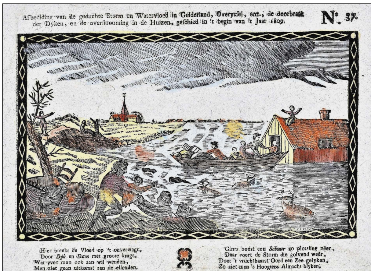
Gedeelte van een prent uitgegeven naar aanleiding van de watersnood van 1809, uitgegeven door J. Wendel en zoon te Amsterdam.

Dit lot trof ook een vrouw met een kind die haar huis niet wilde verlaten. Zij was eerder door haar oude vader en haar broer tijdig met klem aangeraden om het huis te verlaten. Haar vader en broer wilden niet in het huis blijven en vertrokken op tijd. Toen het huis door de watervloed instortte vond zij met het kind het einde in de golven.