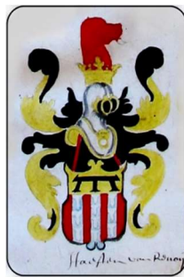
Wapen Van Haften van Rennoij