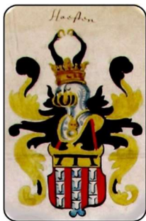
Wapen Van Haften

Leenakten 2, 4, 5, 9a en 10a worden weergegeven in Geschiedenis van Rhenoy (3 e deel)