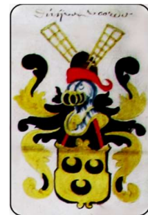
Wapen Van Duijvenvoirde