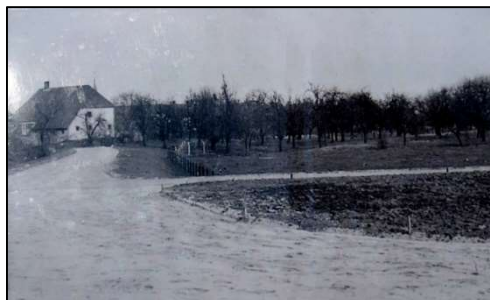
Het huis te Rhenoy en Katholieke kerk 1968